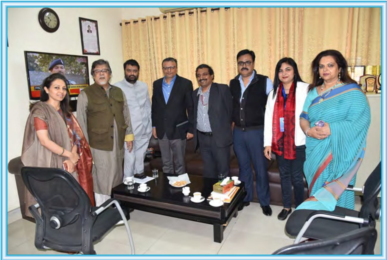
Leading media personalities at the Media Maha Summit held during Media Makakumbh 2018