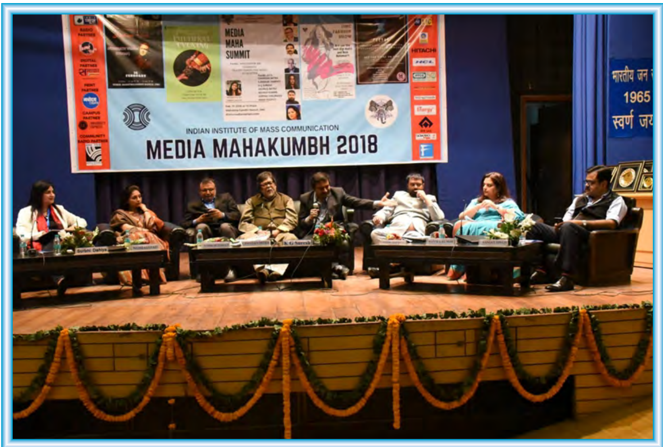
Panel discussion by leading lights of media industry during Media Mahakumbh 2018