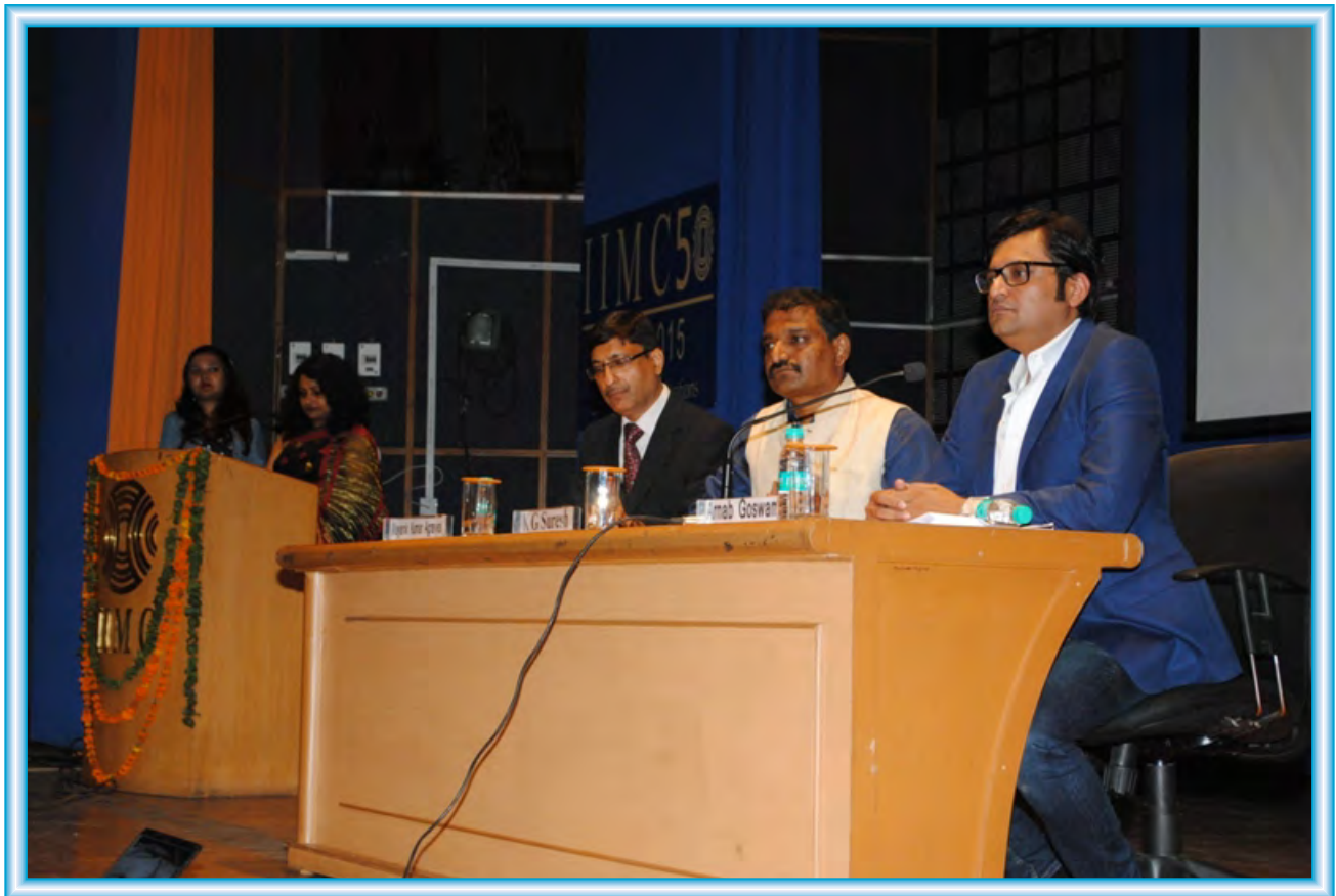
Foundation Day Lecture by Shri Arnab Goswami, Founder and Editor in Chief of Republic TV