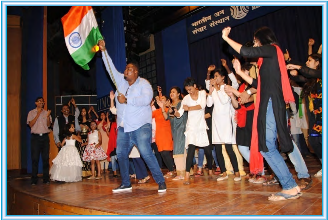
Development Journalism Scholars and PG Diploma students celebrating Independence Day